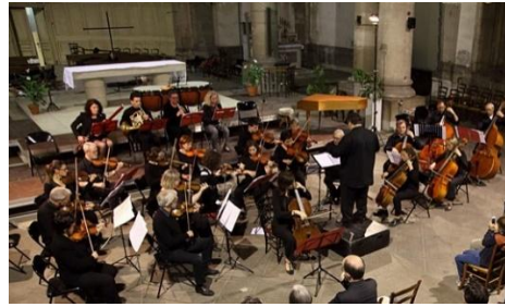
Orchestre Antea Classica