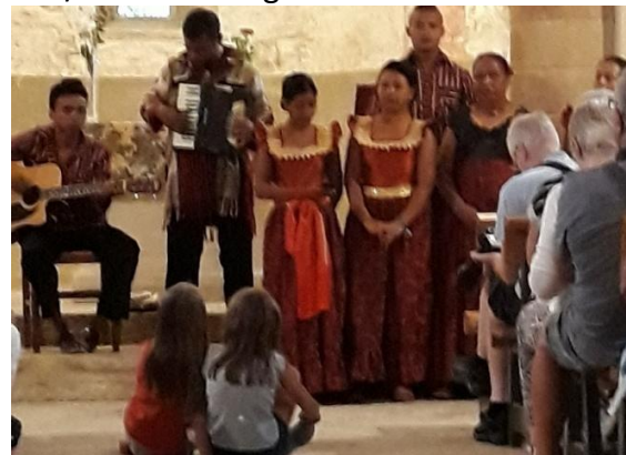
Le groupe Malgache