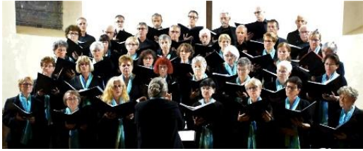
Ensemble vocal Chanteval