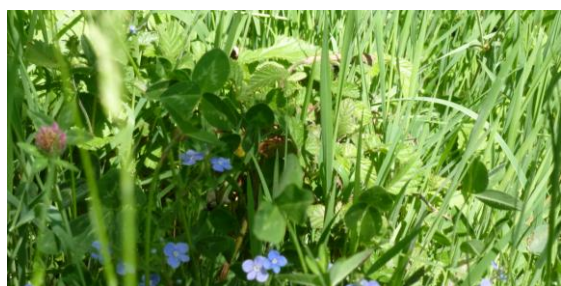
La prairie en fleurs