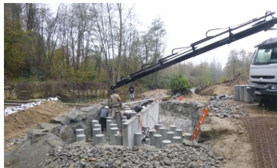
création et Travaux d'une passe à poissons