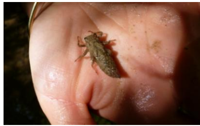
Une larve de libellule

Au printemps, la prairie en fleurs offre de belles harmonies de couleurs,