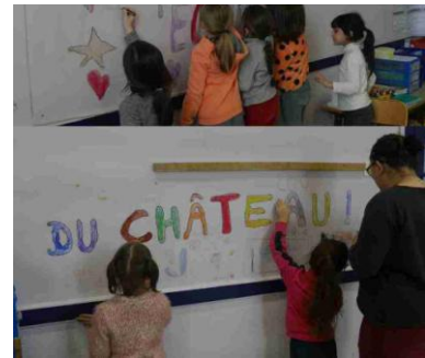
Dernière journée de classe dans l'école du Château.