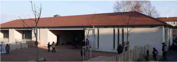
1 er jour de classe dans la nouvelle école par une froide matinée d'hiver.

Au retour des vacances d'hiver, le 26 février 2018, tout était prêt pour accueillir les élèves, le personnel de la cantine et les enseignants.